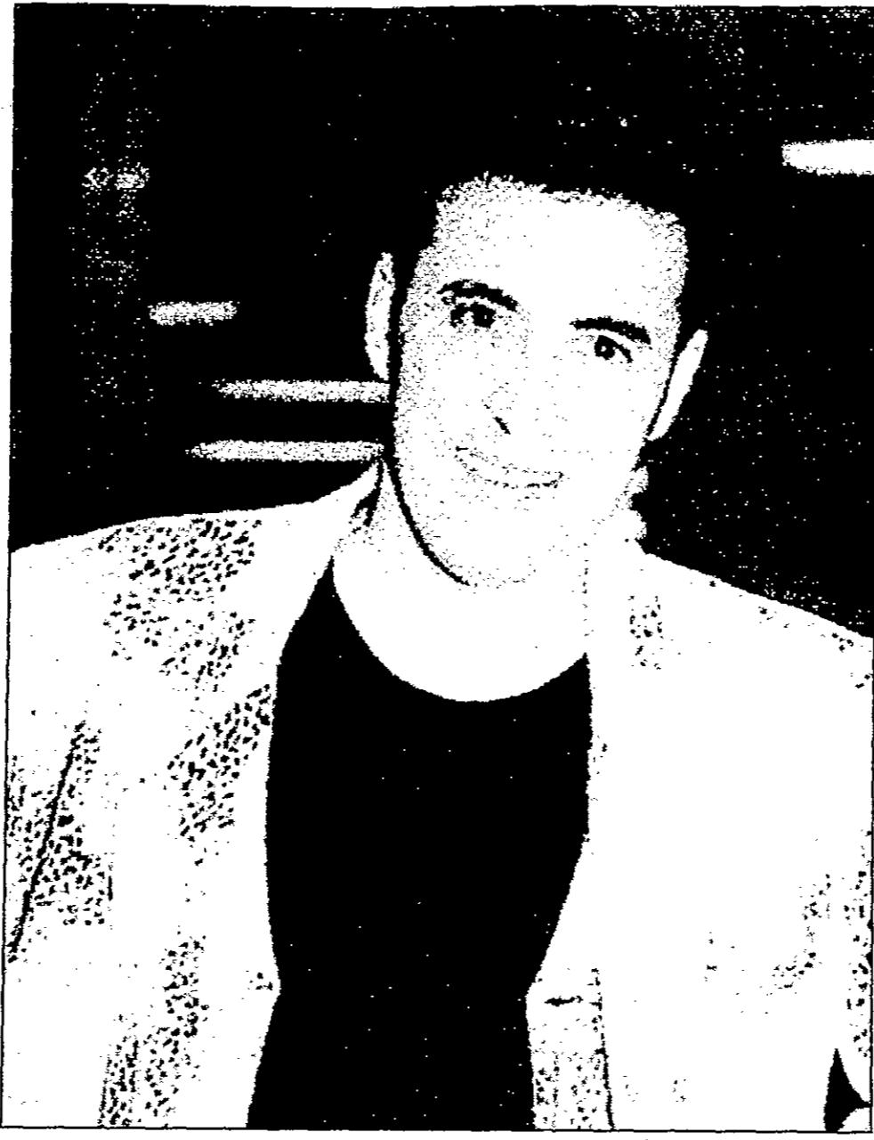
المطرب كاظم الساهر (القدس العربي)

«انا وليلى» عنوان الالبوم رقم 10 للمطرب العراقي كاظم الساهر الذي وزع في الاسواق بداية العام الجاري ويضم 7 اغنيات للشاعر نزار قباني «الا انت» و«حسن الروائي» و«انا وليلى» و«اشيكك ليل» للشاعر عبد الوهاب محمد واربعة اغنيات للشاعر كرم العراقي «اه علي آه» و«بالهداوة» و«الاسمر والابيض» و«أنايات مهموم» واعتبر الساهر في حديث معه عشية توزيع الالبوم في حضور الشاعر كرم العراقي ان «اليوم» انا وليلى» مرحلة جديدة وصعبة في الوقت نفسه في مسيرته الفنية لانه يضم اغانيا جديدة تتميز بلطرب الخميني. ■ سألته في البداية عن رؤيته ونظرة لليوم الجديد؟ ■ «انا وليلى» فيه تجسيد في الشكل الموسيقي بالإضافة الى مزج الدراما والرومانسية وهذا عكس ألبوماتي السابقة التي كانت تعتمد على الطرب المزوج بالحدادة. ■ ما الذي تضحك اليه من خلال اليومك الجديد؟ ■ اسعى الى كسب كل الجمهور باذواقه المتعددة، سواء جمهور السلطنة او الطرب ايام زمان وكيف اصعب الشباب والاطفال اعتمادا على موهبتي وبشيتي واختيار مواضيع تلمس جوانب انسانية داخل الانسان سواء كانت مومنا مشتركة او فردية. ■ سألته في الاخير في روحك، واسالك رغم انك من بلد تحب ان ابدعك يتدفق.. في رايك هل ترى ان الالام الحزن تجرد، الابداع؟ ■ اجابني اقولها بلسان الشاعر كرم العراقي عندما التقى قصيدة في قراخ جاء فيها «الشمس شمسي والعراق عراقي» ما غير الخلاء من اخلاقي، ضغط الحصار على جميع اصابعي فتفجر الابداع في اعماقي، اعتقد ان الانسان العراقي.. انا اتكلم عن حالة اعيشها مع شعراء وادباء وثقافيين.. يتعامل بمزجة نفس، انه ينسى العذاب والالم عندما تأتي لحظة الابداع ينسى اي